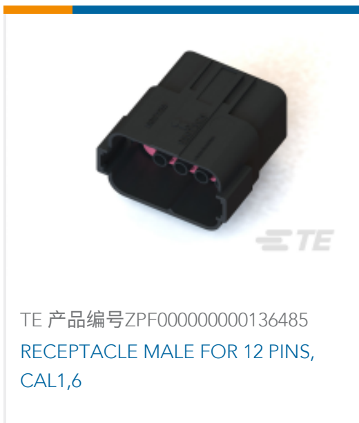
TE 产品编号 ZPF000000000136485 RECEPTACLE MALE FOR 12 PINS, CAL1,6