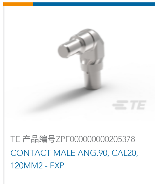
TE 产品编号 ZPF000000000205378 CONTACT MALE ANG.90, CAL20, 120MM2 - FXP