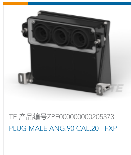
TE 产品编号 ZPF000000000205373 PLUG MALE ANG.90 CAL.20 - FXP