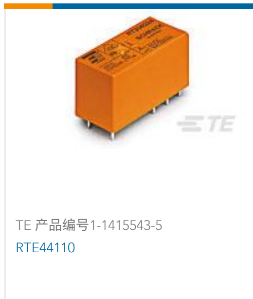
TE 产品编号 1-1415543-5 RTE44110