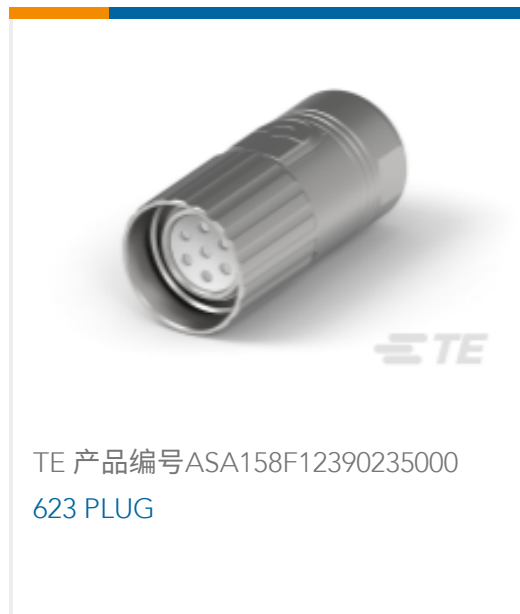
TE 产品编号 ASA158F12390235000 623 PLUG