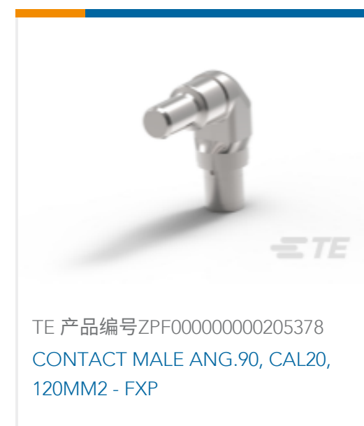
TE 产品编号 ZPF000000000205378 CONTACT MALE ANG.90, CAL20, 120MM2 - FXP