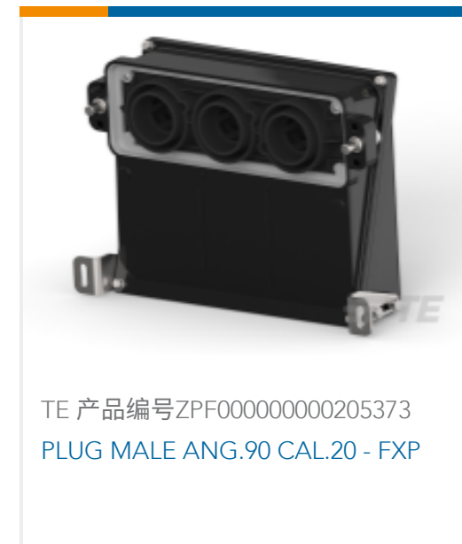
TE 产品编号 ZPF000000000205373 PLUG MALE ANG.90 CAL.20 - FXP