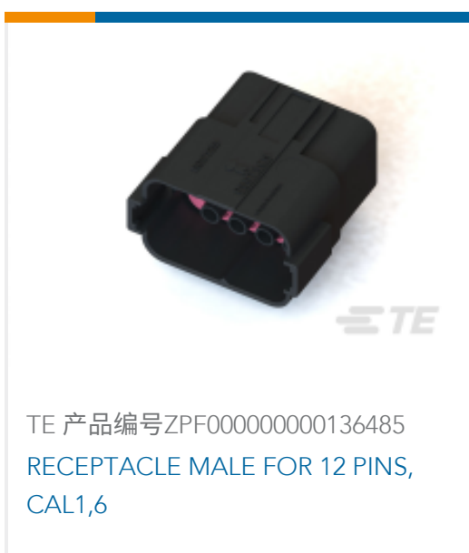
TE 产品编号 ZPF000000000136485 RECEPTACLE MALE FOR 12 PINS, CAL1,6