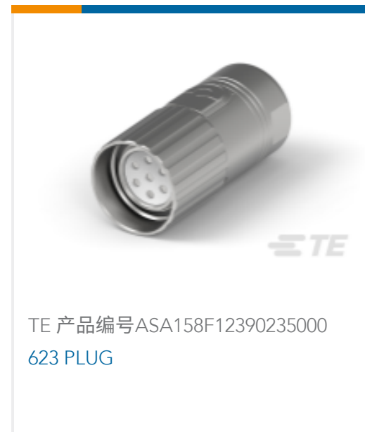
TE 产品编号 ASA158F12390235000 623 PLUG