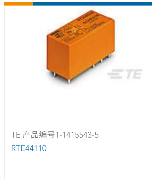
TE 产品编号 1-1415543-5 RTE44110