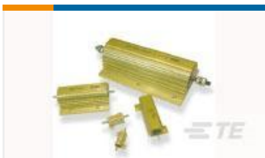
TE 产品编号1625984-1 HSA50 100R 5%