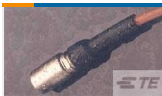
TE 产品编号5873232004 CGAT-3/1-0-STK