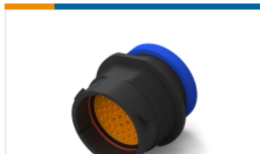
TE 产品编号HDP24-24-47PE-L017 REC, 47P, BLK, E, RNG, 16/20, P