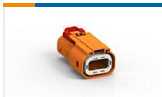
TE 产品编号4-2103015-1 PLUG SUBASSY, A, HVA280-2PHM F