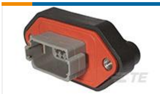
TE 产品编号DT04-12PA-LE01 REC, 12P, GRY, N, CAP, FLANGE, A