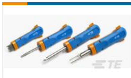
TE 产品编号9-1579007-1 EXTRACTION TOOL