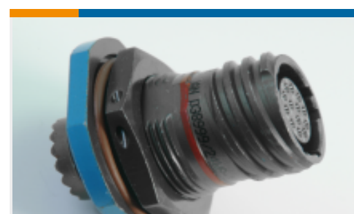
TE 产品编号YDTS24T09-35SNV001 RECP ASSY