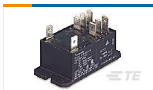
TE 产品编号1-1393212-4 T92S7D22-12