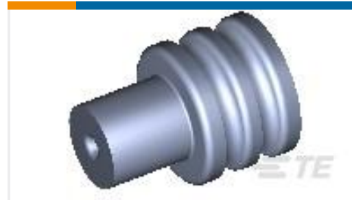
TE 产品编号963294-1 SINGLE WIRE SEAL INSULATION DI