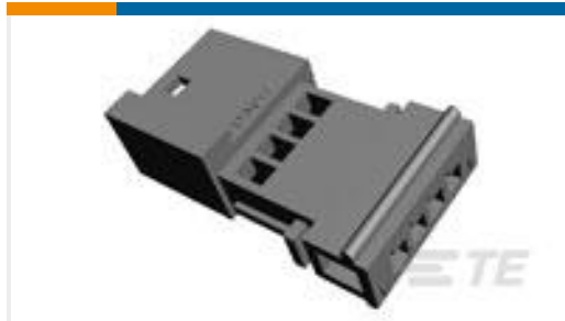
TE 产品编号3-968696-2 MQS STIFT-GEH 4P