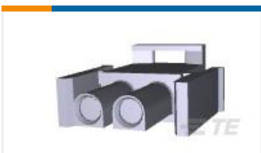
TE 产品编号350777-1 02P UMNL PLUG HSG