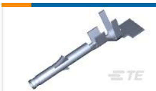
TE 产品编号171639-1 MINI U-M-N-L SOCKET L.P