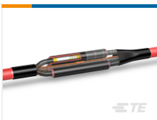
TE 产品编号E35363-000 EPKJ-24C/1XU-1HL-DE05