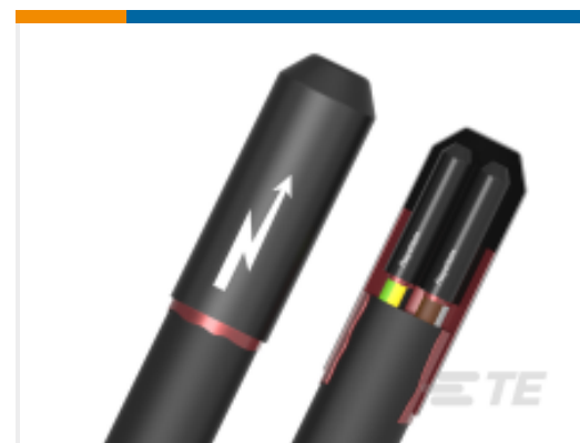
TE 产品编号679105-000 EPKE-0084-(S25)