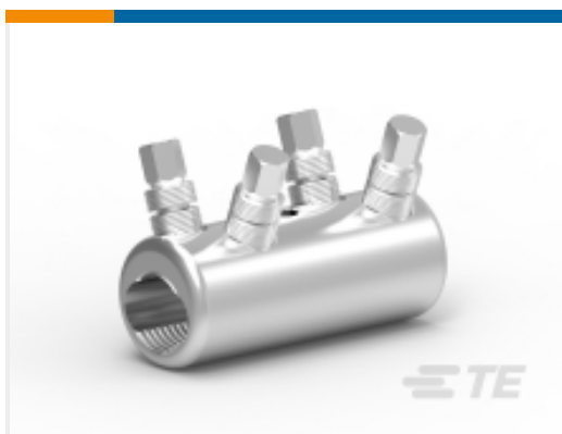
TE 产品编号2107440-2 BSLU-95/240