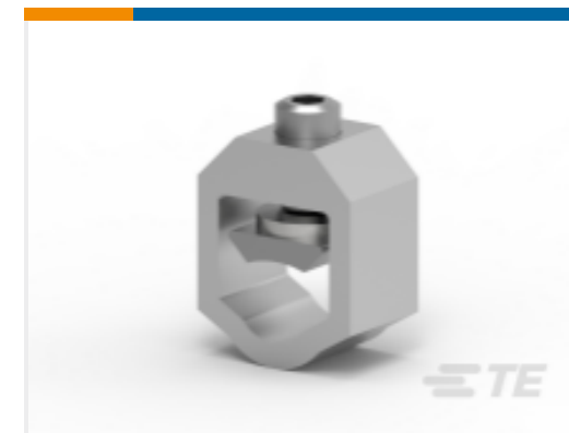
TE 产品编号388998-000 HEL-4712