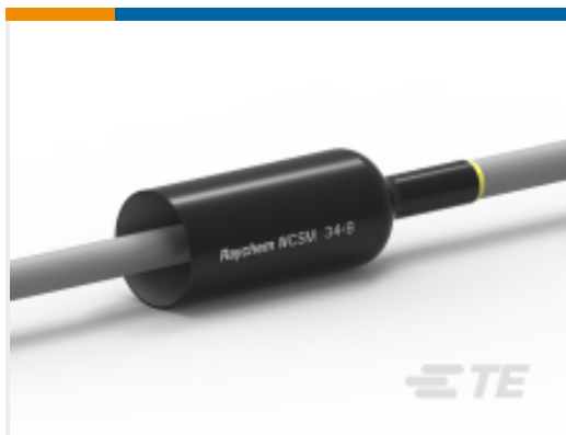
TE 产品编号CU7128-000 WCSM-34/8-1000/S(S10)