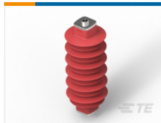
TE 产品编号EN4832-000 HDA-12MA-B3-NFF