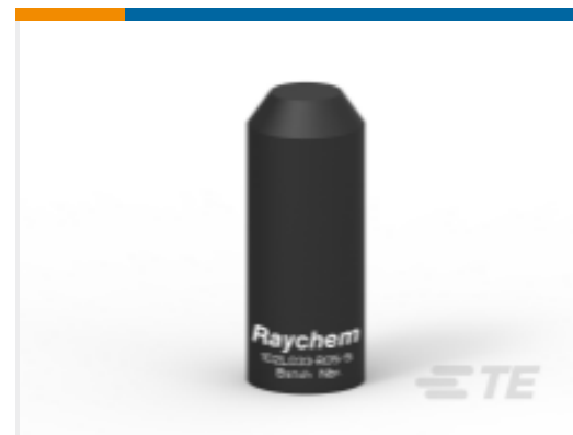
TE 产品编号BM5711N002 102L044-R05/S(S25)