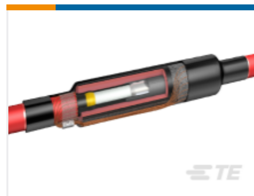
TE 产品编号691269-005 MXSU-3131