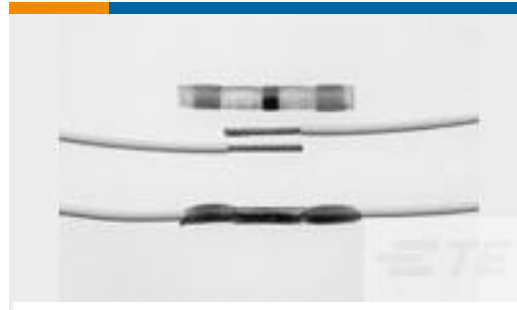
TE 产品编号D33598-000 B-152-9003