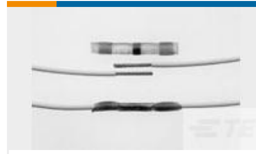
TE 产品编号F80600-000 B-152-9004