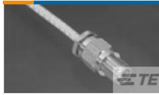
TE 产品编号 1051900-1 2032 8007 92