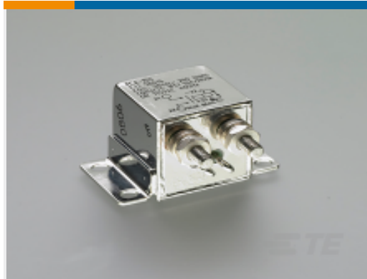
TE 产品编号 5-1617800-8 FCAC-150-KY4=50 AMP MID RANGE RELAY