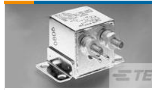
TE 产品编号 9-1617806-7 FCA-150-KY4=50 AMP 1PST/NO DM RELAY