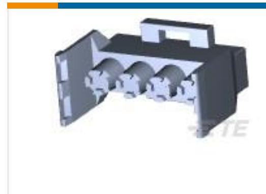
TE 产品编号770050-1 04P UMNL II CAP REAR 94VO