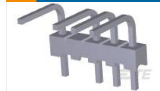
TE 产品编号3-647161-1 05P MTA100 HDR ASSY W/O#4 SN