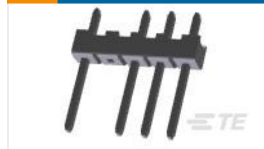
TE 产品编号3-644454-1 05P MTA100 HDR W/O#4 NARROW