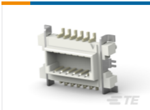
TE 产品编号1-179397-2 ON TAPING(EMBOSS) 0.8FS 3.0MM