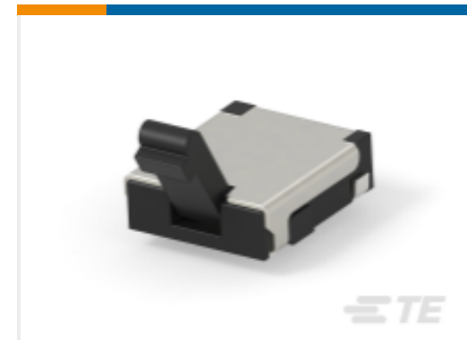
TE 产品编号2331415-1 DET SW4.2X3.6X1.2 JB VERT(DW) NO AGAU RL