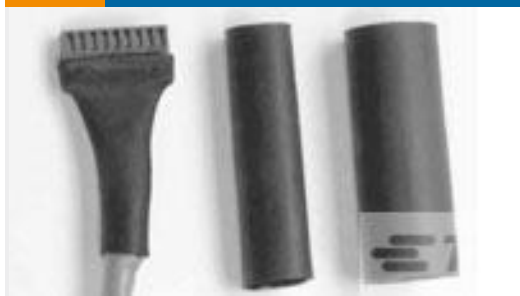
TE 产品编号968875-000 DWP-125-1/4-0-1.25IN