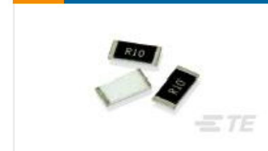
TE 产品编号2-1879464-9 RL73H 2H R18 1% 1K RL