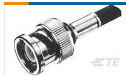
TE 产品编号5225886-4 PLUG,DUAL CRIMP,BNC