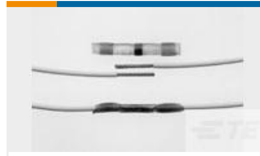
TE 产品编号D33598-000 B-152-9003