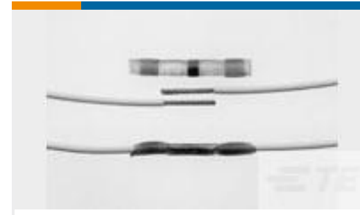
TE 产品编号F80600-000 B-152-9004