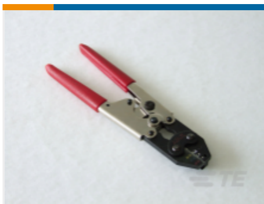
TE 产品编号 992008-000 AD-1377-CRIMP-TOOL-3-CVTY