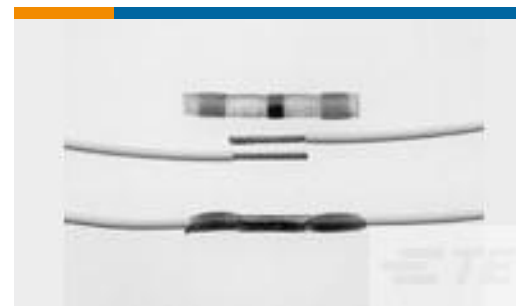
TE 产品编号F80600-000 B-152-9004