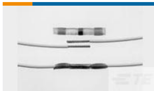
TE 产品编号D33598-000 B-152-9003