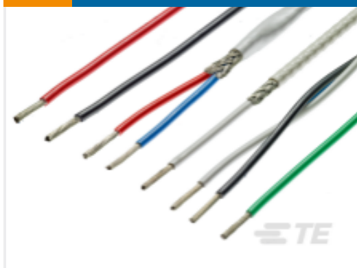
TE 产品编号895819-000 44B1131-20-MST3-9CS2275