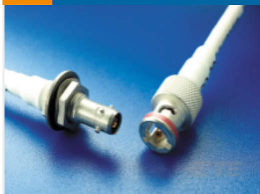
TE 产品编号613049-000 D-621-0436