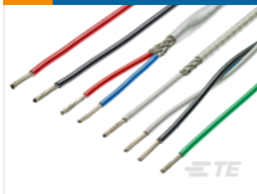
TE 产品编号EG7214-000 44A0121-22-9/958