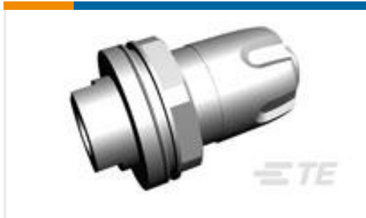
TE 产品编号1693741-1 CONN SHELL KIT, D-HOLE BULKHD, HA