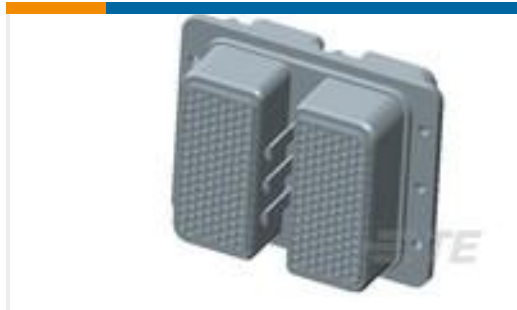
TE 产品编号445595-4 PLG KIT,ARINC 404,W/O CONTACTS