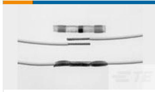
TE 产品编号D33598-000 B-152-9003