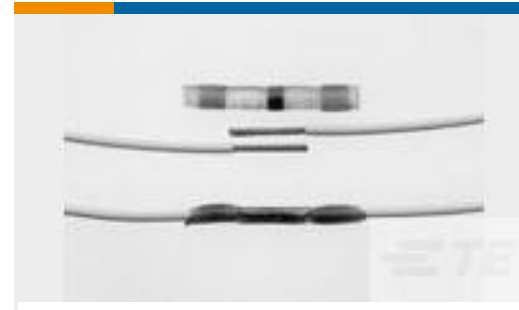
TE 产品编号F80600-000 B-152-9004