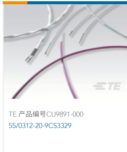
TE 产品编号CU9891-000 55/0312-20-9CS3329