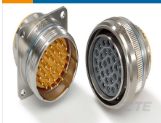
TE 产品编号ZPF00000000009007 983-6SE 22-55 SN-L