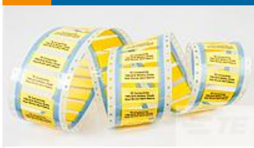
TE 产品编号8350110001 TMS-SCE-1/8-2.0-9