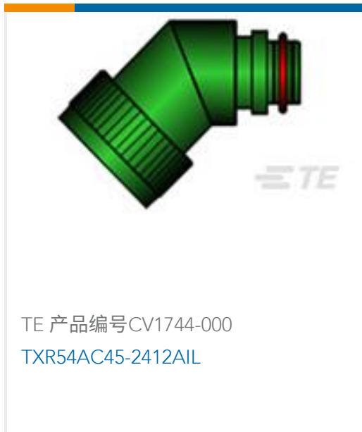
TE 产品编号CV1744-000 TXR54AC45-2412AIL