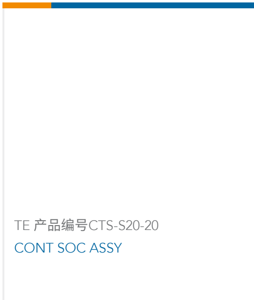
TE 产品编号CTS-S20-20 CONT SOC ASSY