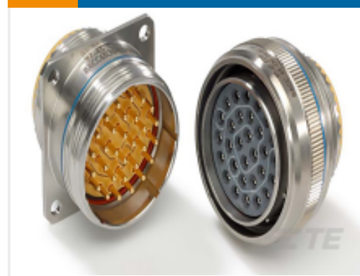
TE 产品编号ZPF00000000039864 983-7SE 24-61 S8 L