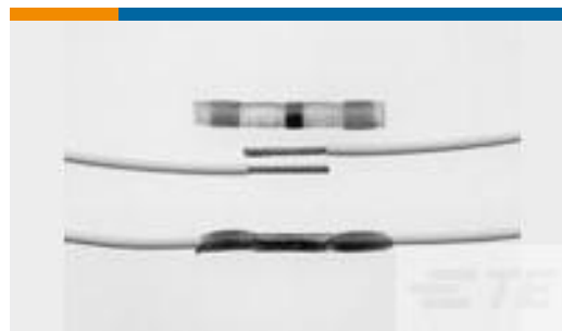
TE 产品编号D33598-000 B-152-9003