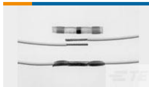
TE 产品编号F80600-000 B-152-9004