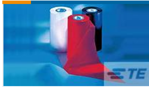
TE 产品编号F55931-000 1966-RIBBON