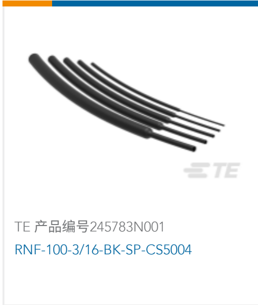
TE 产品编号245783N001 RNF-100-3/16-BK-SP-CS5004