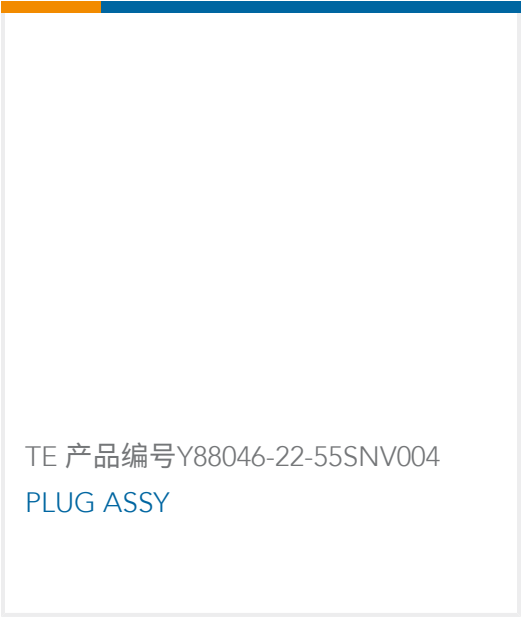
TE 产品编号Y88046-22-55SNV004 PLUG ASSY