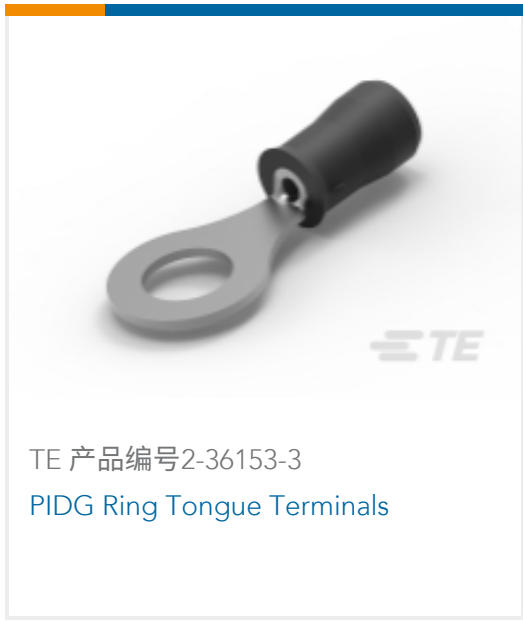
TE 产品编号2-36153-3 PIDG Ring Tongue Terminals