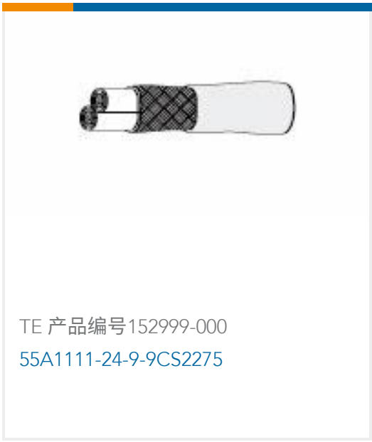
TE 产品编号152999-000 55A1111-24-9-9CS2275