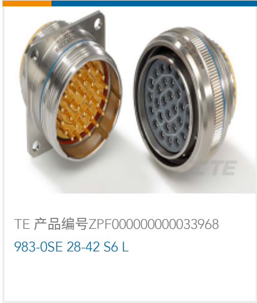
TE 产品编号ZPF00000000000033968 983-0SE 28-42 S6 L