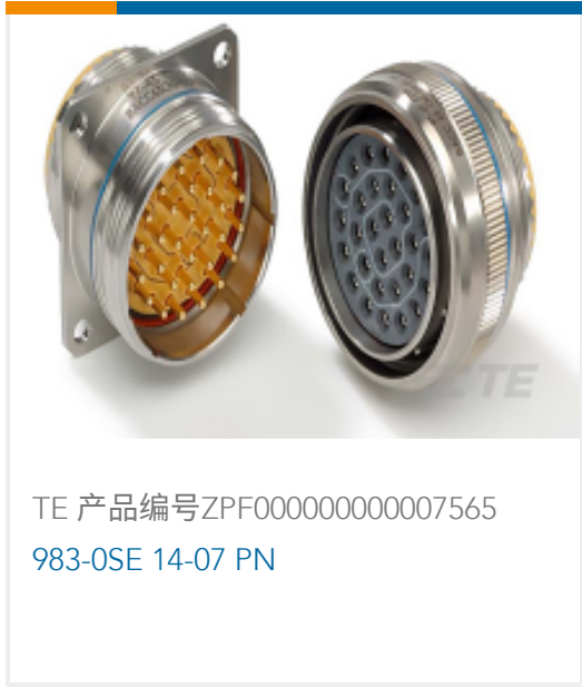
TE 产品编号ZPF0000000000007565 983-0SE 14-07 PN