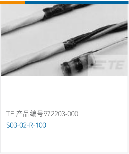
TE 产品编号972203-000 S03-02-R-100