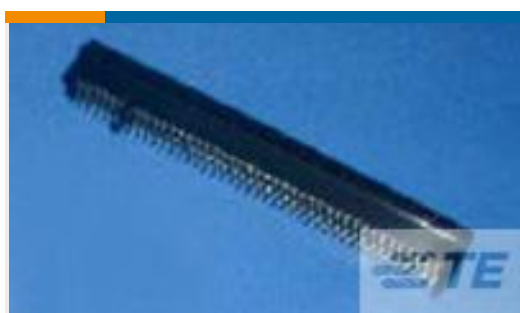
TE 产品编号 1734774-1 PCI EXP 3.1L 36 POS WHT G/F