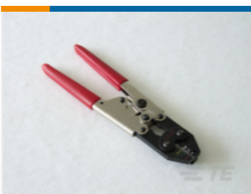
TE 产品编号 992008-000 AD-1377-CRIMP-TOOL-3-CVTY