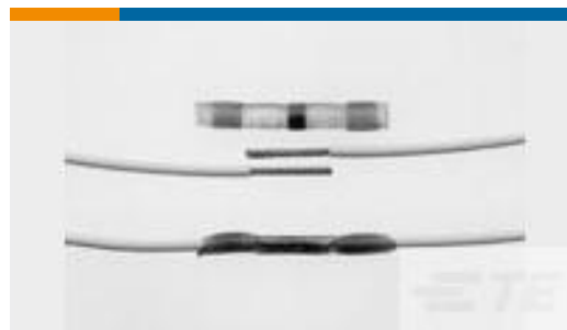
TE 产品编号D33598-000 B-152-9003