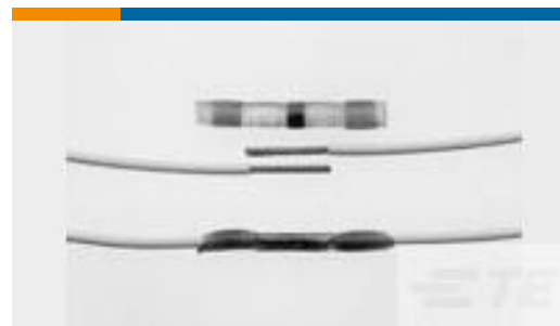
TE 产品编号F80600-000 B-152-9004