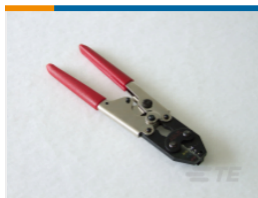
TE 产品编号 992008-000 AD-1377-CRIMP-TOOL-3-CVTY