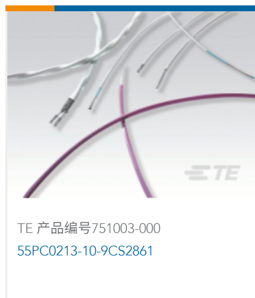
TE 产品编号751003-000 55PC0213-10-9CS2861