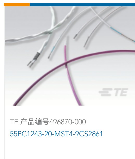
TE 产品编号496870-000 55PC1243-20-MST4-9CS2861