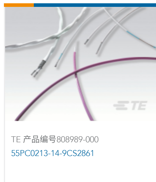
TE 产品编号808989-000 55PC0213-14-9CS2861