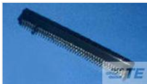
TE 产品编号 1734774-1 PCI EXP 3.1L 36 POS WHT G/F