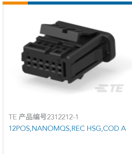
TE 产品编号2312212-1 12POS,NANOMQS,REC HSG,COD A