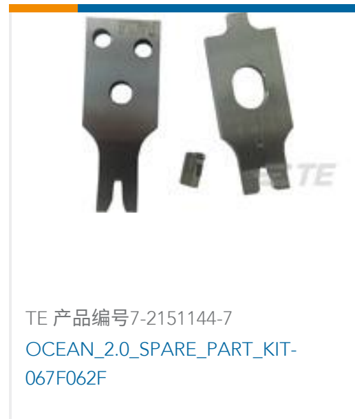
TE 产品编号7-2151144-7 OCEAN_2.0_SPARE_PART_KIT-067F062F