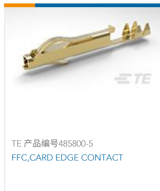
TE 产品编号485800-5 FFC,CARD EDGE CONTACT