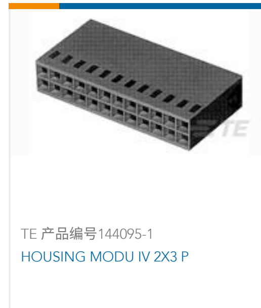
TE 产品编号144095-1 HOUSING MODU IV 2X3 P