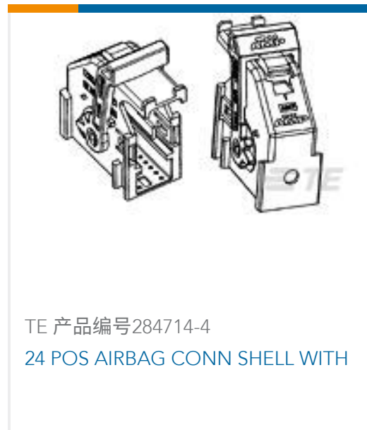
TE 产品编号284714-4 24 POS AIRBAG CONN SHELL WITH