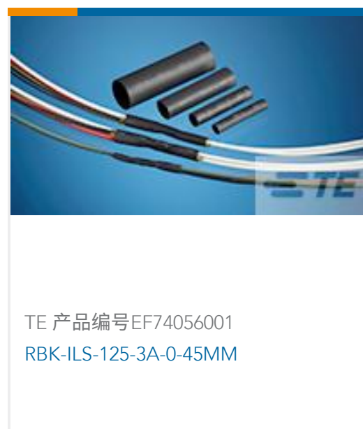
TE 产品编号EF74056001 RBK-ILS-125-3A-0-45MM