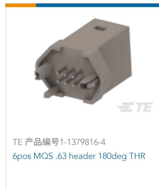
TE 产品编号1-1379816-4 6pos MQS .63 header 180deg THR