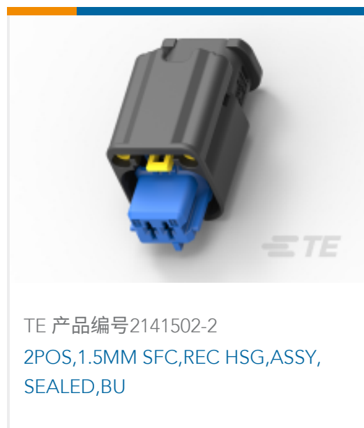
TE 产品编号2141502-2 2POS,1.5MM SFC,REC HSG,ASSY, SEALED,BU