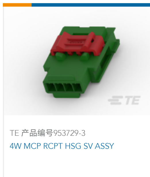
TE 产品编号953729-3 4W MCP RCPT HSG SV ASSY