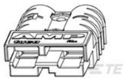
TE 产品编号 647845-3 SERIES 50 HOUSING,RED