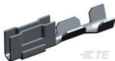
TE 产品编号1375819-2 CST-100 II CONTACT 15 GOLD PLT