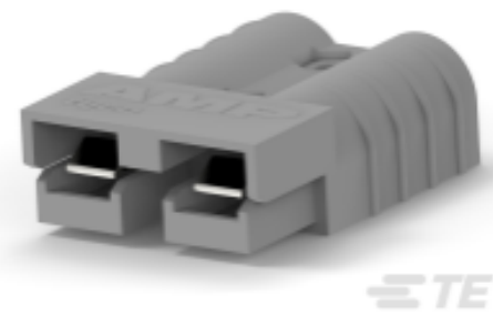
TE 产品编号 647892-4 SRS 50 CONN KIT,GRAY,6 AWG