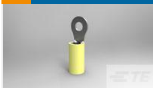
TE 产品编号2-320568-3 TERMINAL,PIDG R IR 10 8