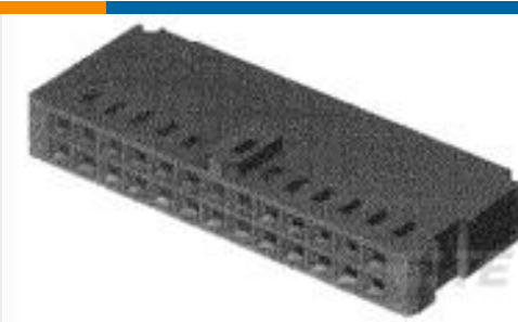
TE 产品编号102387-9 40 MODIV HSG COMP DR .100 POL