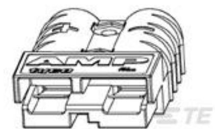
TE 产品编号647845-7 SERIES 50 HOUSING,BLACK