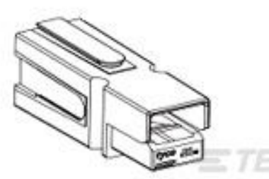
TE 产品编号1445715-5 75A HSG SUBASSY RED