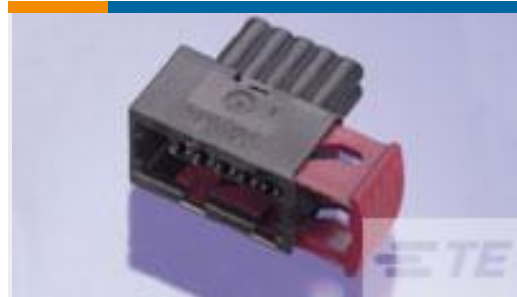
TE 产品编号2-967059-1 J-P-T GEH KOMPL 4P