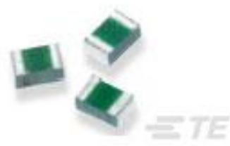
TE 产品编号1624345-1 NTC0805 5% 10K