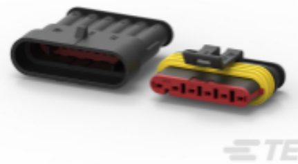
TE 产品编号 282104-1 AMP SUPERSEAL 1.5MM, 连接器壳体