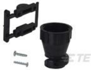
TE 产品编号 206070-8 CABLE CLAMP KIT #17