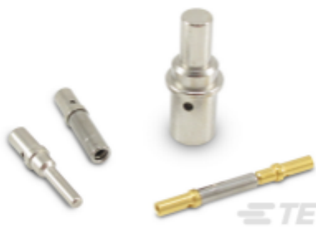
TE 产品编号 0460-202-16141 DEUTSCH Solid Contacts