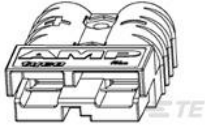
TE 产品编号 647845-3 SERIES 50 HOUSING, RED