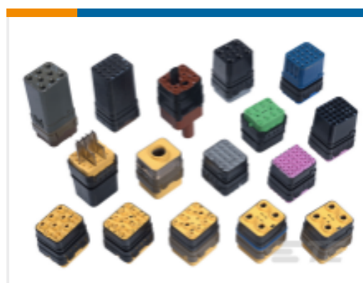
TE 产品编号ZPF00000000148762 DMC-M 99-04 AN (=33537-P0000)