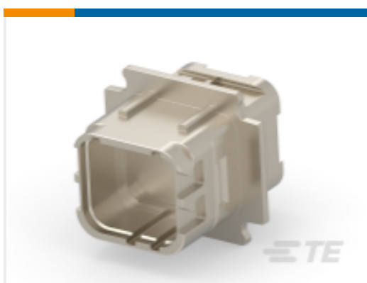
TE 产品编号ZPF00000000146309 Rectangular Connector Receptacle Extenders, Tool-less Assembly