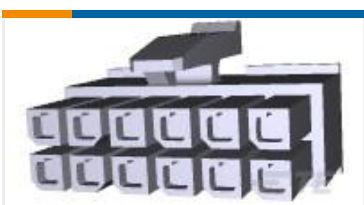
TE 产品编号1-794617-2 12POS,MICRO MNL,RCPT HSG