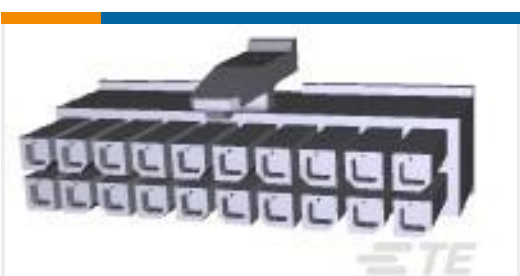
TE 产品编号2-794617-0 20POS,MICRO MNL,RCPT HSG