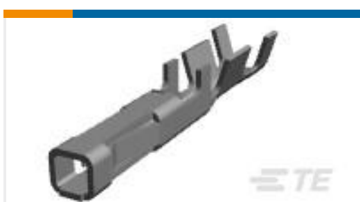
TE 产品编号1-794610-2 MICRO MNL RPT CNT,LS PC 30AU L