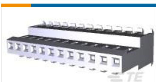
TE 产品编号4-640621-2 12P MTA100 CONN ASSY F/T NATL