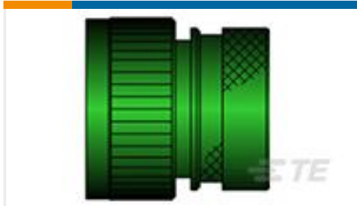
TE 产品编号808657-000 201M124-19C