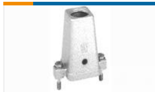
TE 产品编号1106402-2 EMV-K.3/4.STO.1.M16.G