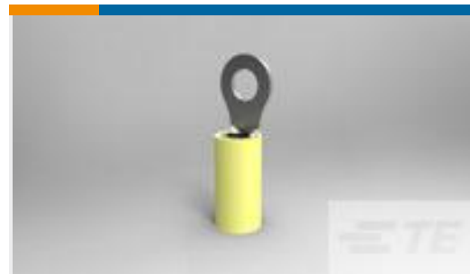
TE 产品编号2-35109-1 PIDG 12-10 R 10; TAPE