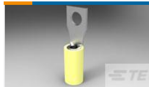
TE 产品编号329697 TERMINAL,PIDG RECT 12-10 6