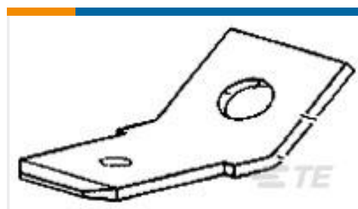
TE 产品编号60465-2 250 FASTON TAB TPBR