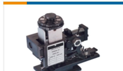
TE 产品编号567200-2 APPL,HDM,TAPE 9 CB W/O DIES K