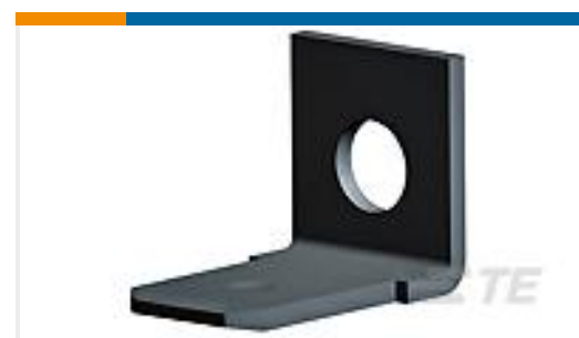
TE 产品编号42214-2 250 FASTON TAB TPBR