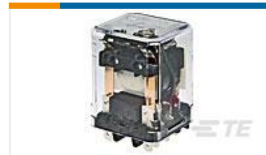
TE 产品编号8-1393113-7 KUEP-11D15-24=KU-