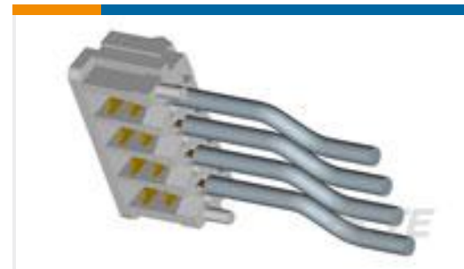
TE 产品编号173977-4 CT CONN MT REC ASSY 4P