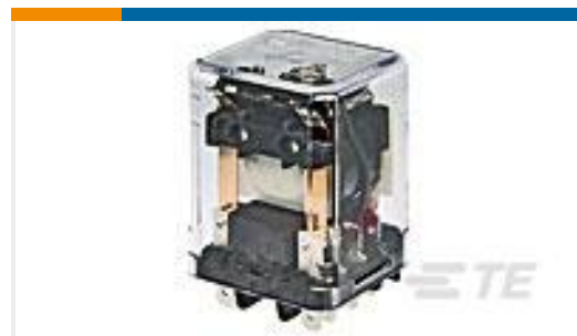
TE 产品编号1393114-5 KUEP-3D35-24=KU