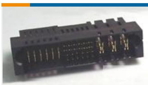
TE 产品编号 6450842-2 MBXLE R/A HEADER 3ACP8P24S