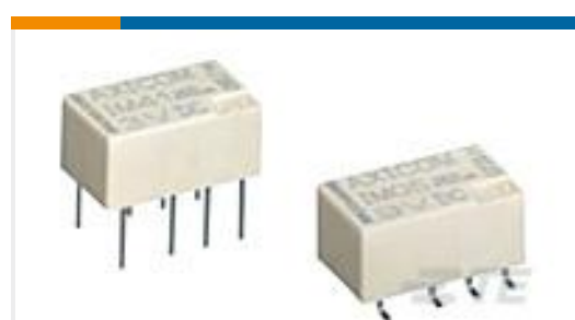
TE 产品编号1462037-1 IM01GR=IM RELAY 140mW 3V