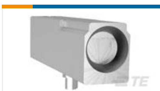
TE 产品编号5223986-1 UPM KEYED GUIDE MODULE