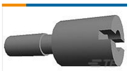
TE 产品编号787004-3 .8MM SCREWLOCK BRDMT,BULK