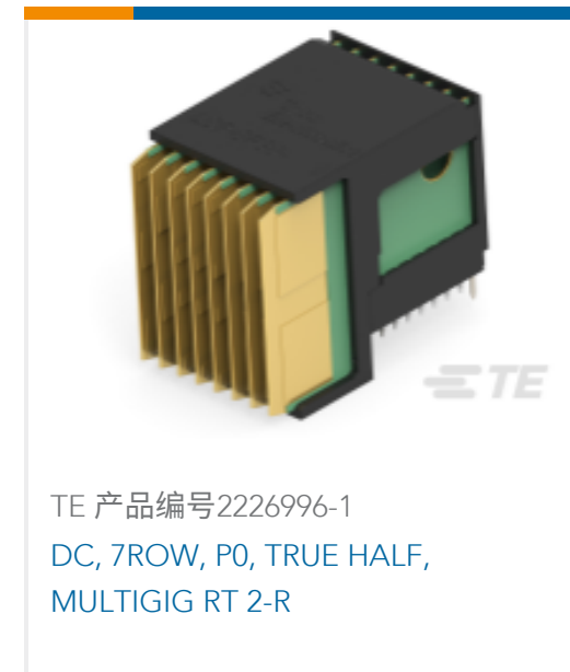
TE 产品编号2226996-1 DC, 7ROW, P0, TRUE HALF, MULTIGIG RT 2-R