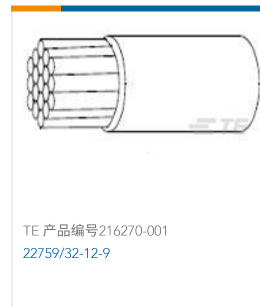
TE 产品编号216270-001 22759/32-12-9