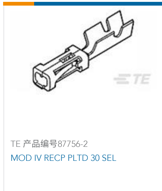
TE 产品编号87756-2 MOD IV RECP PLTD 30 SEL