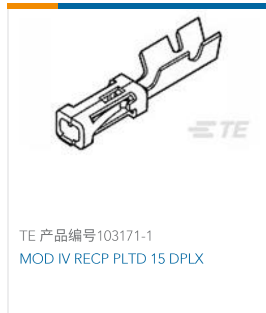
TE 产品编号103171-1 MOD IV RECP PLTD 15 DPLX