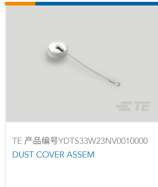
TE 产品编号YDTS33W23NV0010000 DUST COVER ASSEM