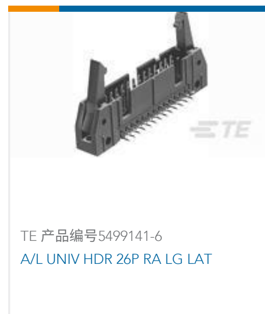
TE 产品编号5499141-6 A/L UNIV HDR 26P RA LG LAT