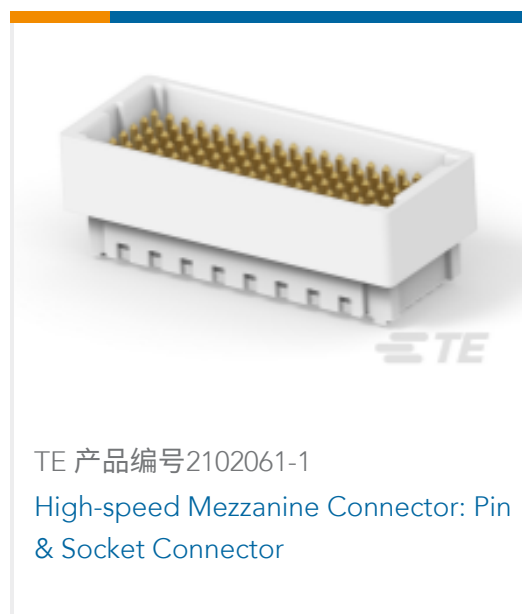
TE 产品编号2102061-1 High-speed Mezzanine Connector: Pin & Socket Connector