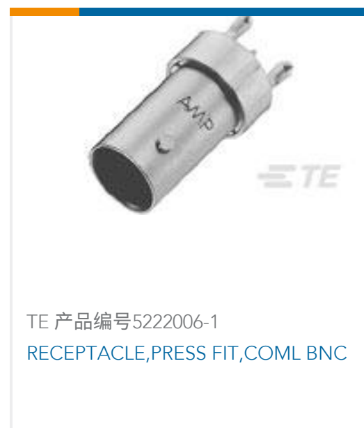
TE 产品编号5222006-1 RECEPTACLE,PRESS FIT,COML BNC