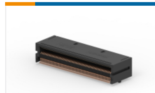
TE 产品编号2274845-1 CFP2 RECEPTACLE ASSEMBLY