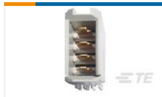
TE 产品编号1903977-1 SLIM UPM 4POS. R/A HDR ASSEMBL