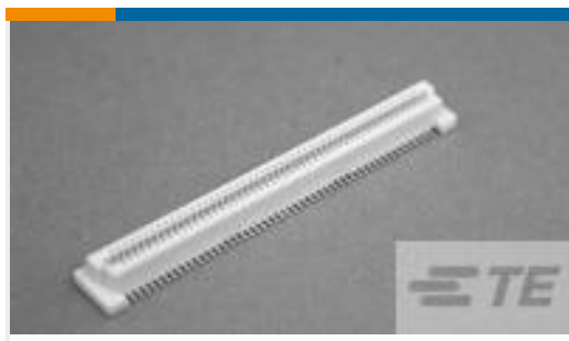
TE 产品编号5177985-1 0.8FH,R05H.5,040,08/Sn,TR,SC