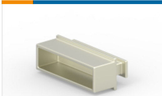
TE 产品编号2288221-1 CFP2 EM/DUST PLUG