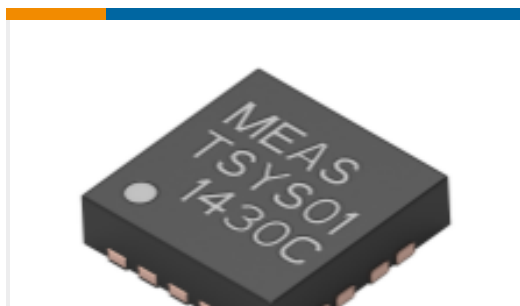
TE 产品编号G-NICO-018 0.1 DEG C ACCURACY QFN TEMP SENSOR