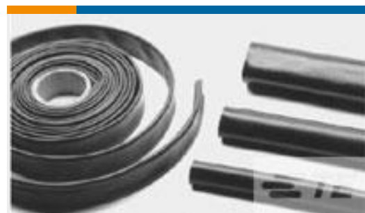
TE 产品编号CB5437-000 XFFR-11X4