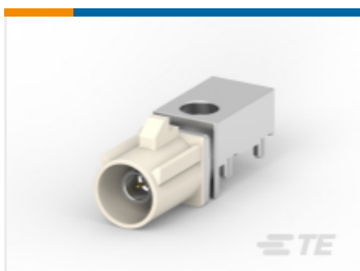
TE 产品编号5-2287906-2 FAKRA, 1 POS, EDGE MOUNT, 12 OCLOCK ASSY