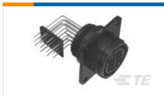
TE 产品编号1-796403-2 CPC PSTD RCPT, 11-4, R/A LF