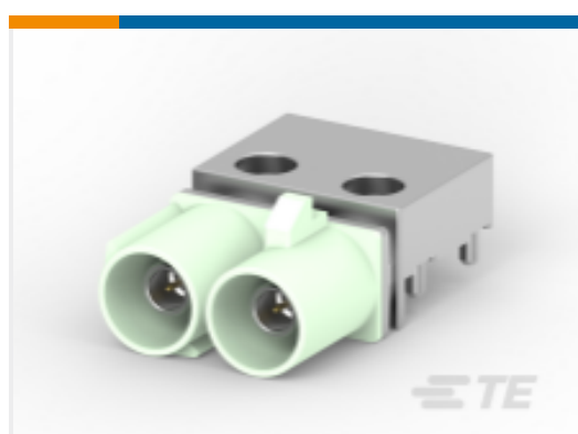
TE 产品编号6-2287923-3 FAKRA, 2 POS, EXT-EDGE, ASS'Y 12 O'CLOCK