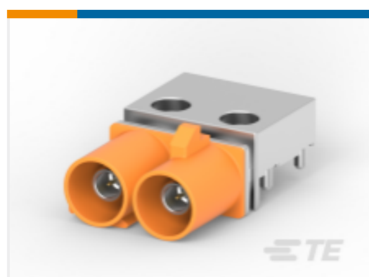
TE 产品编号6-2287923-2 FAKRA, 2 POS, EXT-EDGE, ASS'Y 12 O'CLOCK