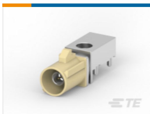
TE 产品编号5-2287906-9 FAKRA, 1 POS, EDGE MOUNT, 12 OCLOCK ASSY