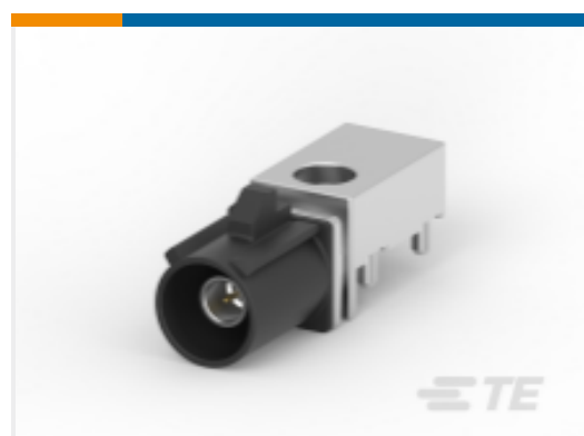
TE 产品编号5-2287906-1 FAKRA, 1 POS, EDGE MOUNT, 12 OCLOCK ASSY