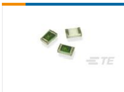
TE 产品编号4-2176093-8 RP 2A 0.25W 30K1 0.1% 25PPM 1K RL