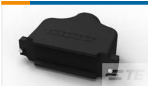
TE 产品编号5745175-1 CABLE CLAMP KIT,SZ 5