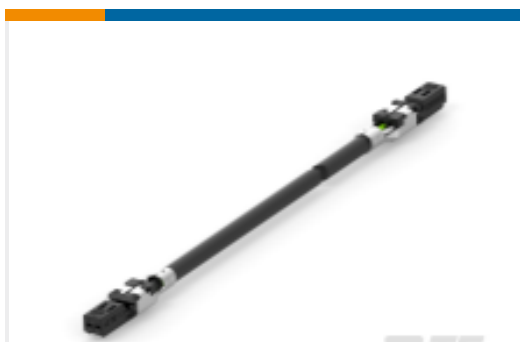
TE 产品编号2362764-2 MATENET,CABLE ASSY,1 GBPS UTP