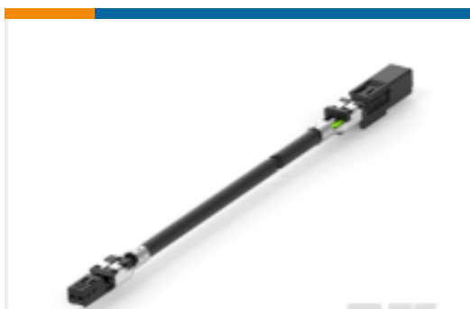
TE 产品编号2362767-1 MATENET,CABLE ASSY,1 GBPS UTP