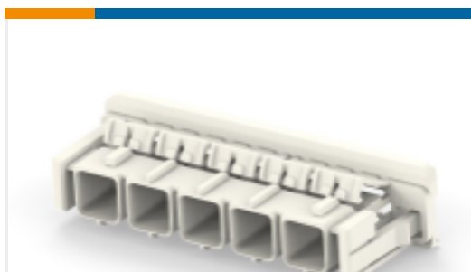
TE 产品编号2302455-2 5-PORT MATENET FRAME, UTP, COD B