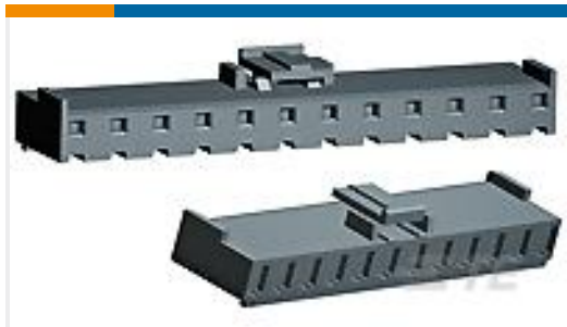
TE 产品编号1744036-3 03P ECONOMY POWER .200 CL HSG