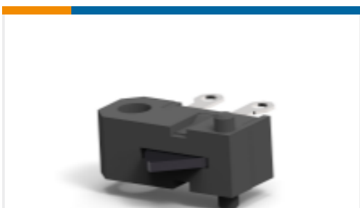
TE 产品编号2331416-1 DET SW10.0X3.8X4.5 LOCK VERT. NO AG BLK