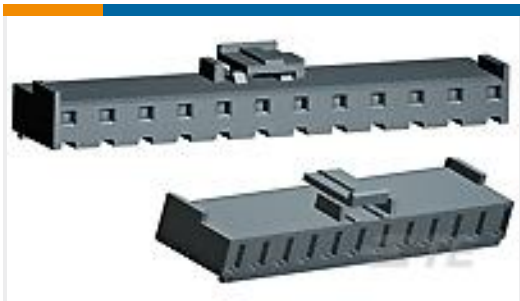
TE 产品编号1744036-2 02P ECONOMY POWER .200 CL HSG