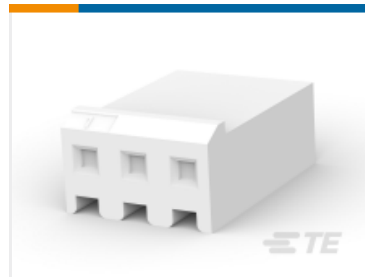
TE 产品编号 CAT-103156-WBHSM Receptacle Housing: Wire-to-Board, with Mating Alignment, SL156