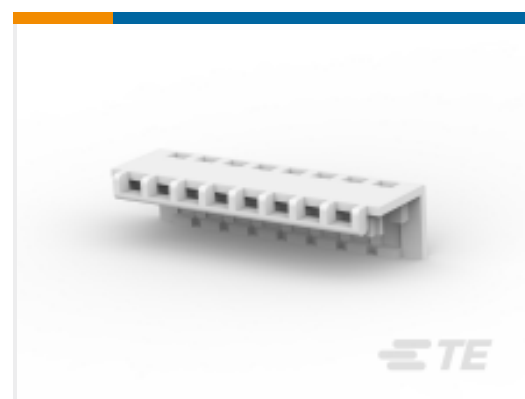
TE 产品编号 643067-9 09P MTA156 MOLDED COVER