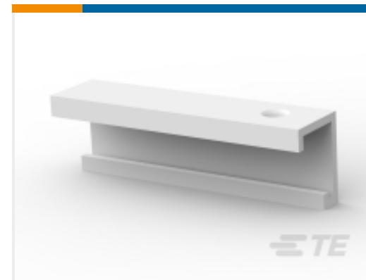
TE 产品编号 640551-9 09P MTA156 COVER