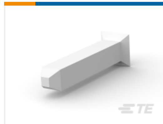
TE 产品编号 640629-1 MTA156 KEYING PLUG