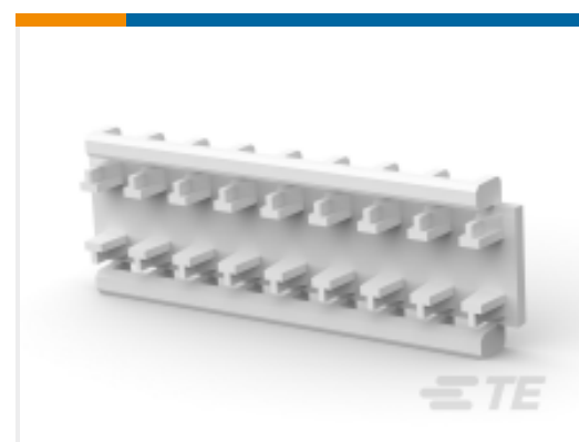
TE 产品编号 643071-9 09P MTA156 FD-THRU COVER