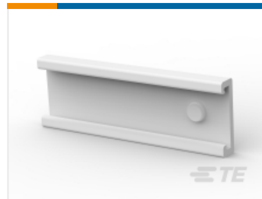
TE 产品编号 640643-9 09P MTA156 COVER F/T