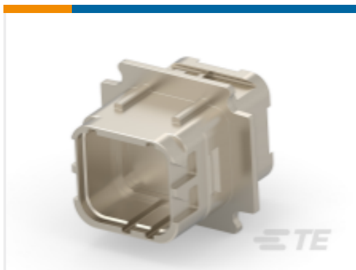
TE 产品编号ZPF00000000146309 Rectangular Connector Receptacle Extenders, Tool-less Assembly