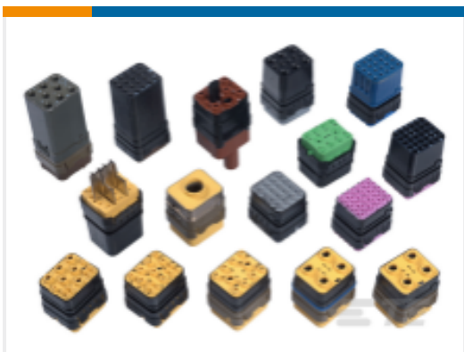
TE 产品编号ZPF00000000148762 DMC-M 99-04 AN (=33537-P0000)