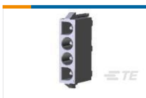
TE 产品编号641968-4 4P UMNL PIN HDR POL VO, AU, LF