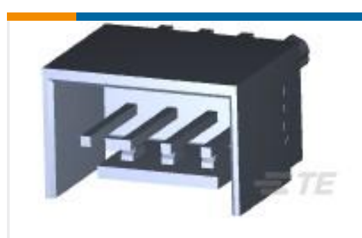
TE 产品编号3-644897-4 04P CST100 SHRD HDR ASSY LF