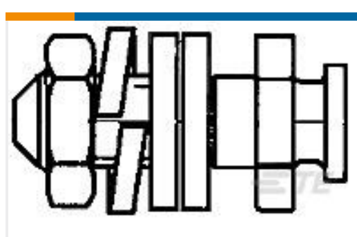
TE 产品编号5206514-7 SLIDING LOCK POST KIT,BULK PKG