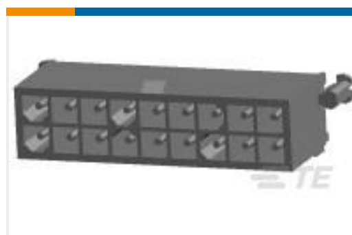
TE 产品编号1-794076-1 18P MINI UMNL HDR W/O DH AU LF