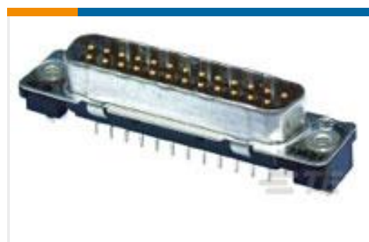
TE 产品编号748027-1 25 PLUG SP/FMS (IN,SL)