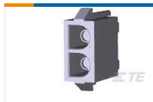
TE 产品编号643412-3 02P UMNL HDR ASSY POL LF