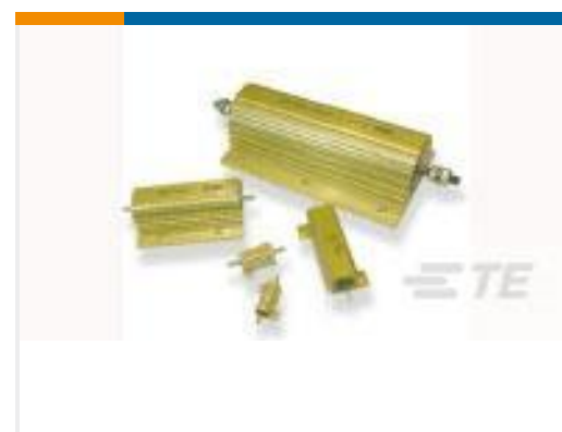
TE 产品编号1-1630019-4 HSC200 2K4 5%