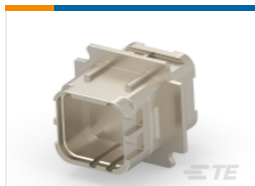
TE 产品编号ZPF00000000146309 Rectangular Connector Receptacle Extenders, Tool-less Assembly