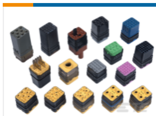
TE 产品编号ZPF00000000148762 DMC-M 99-04 AN (=33537-P0000)