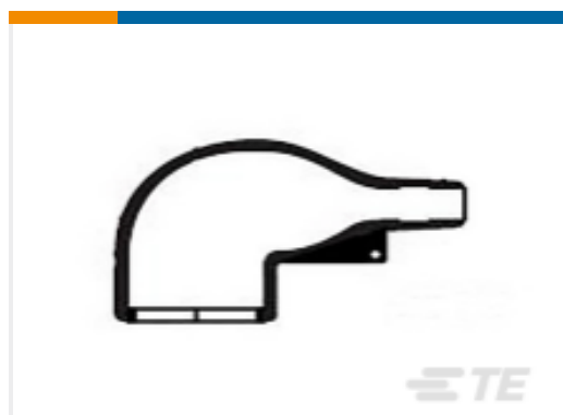
TE 产品编号EF9981-000 222K121-25L/225-0