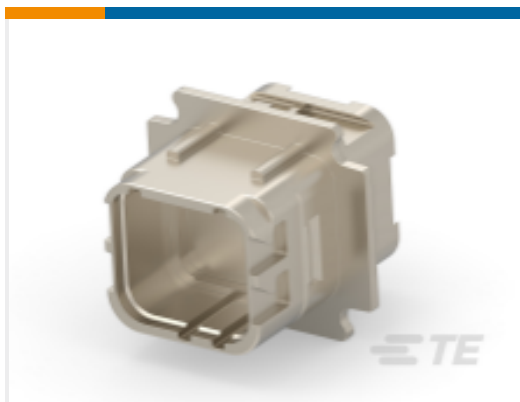
TE 产品编号ZPF00000000146309 Rectangular Connector Receptacle Extenders, Tool-less Assembly