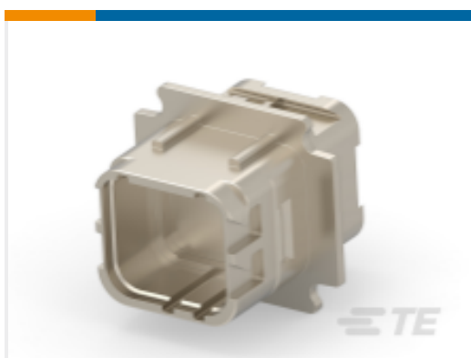
TE 产品编号ZPF000000000146309 Rectangular Connector Receptacle Extenders, Tool-less Assembly