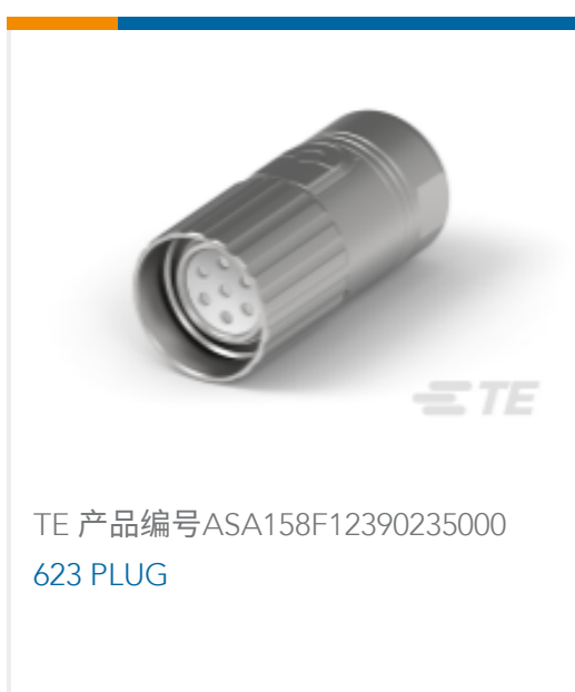
TE 产品编号ASA158F12390235000 623 PLUG