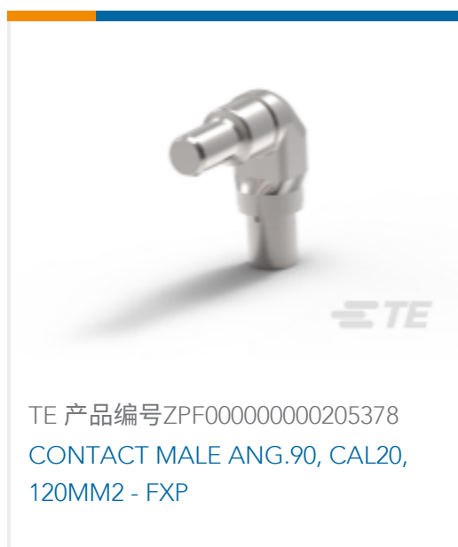
TE 产品编号ZPF000000000205378 CONTACT MALE ANG.90, CAL20, 120MM2 - FXP