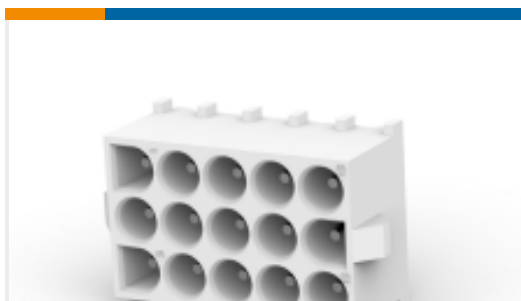
TE 产品编号1586170-1 15P UMNL PIN HDR 94VO NDH