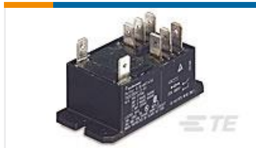
TE 产品编号9-1393211-0 T92S11D12-24