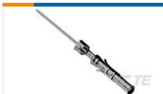
TE 产品编号1-66473-9 SKT,.062 DIA,.045 SQ POST,LP