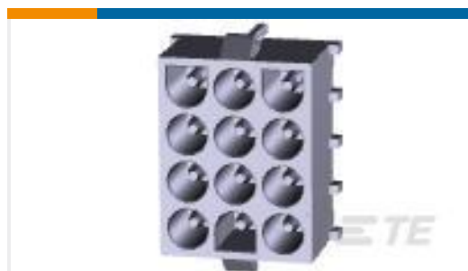
TE 产品编号641973-1 12P UMNL PIN HDR ASSY V2 NATL