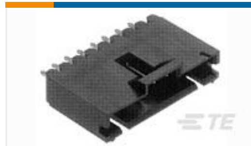
TE 产品编号5-103735-2 03 MTE HDR SRST LATCH .100CL