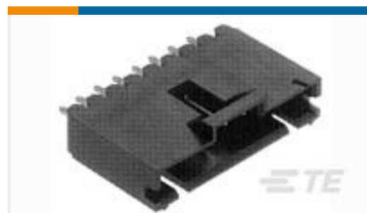
TE 产品编号5-103735-3 04 MTE HDR SRST LATCH .100CL