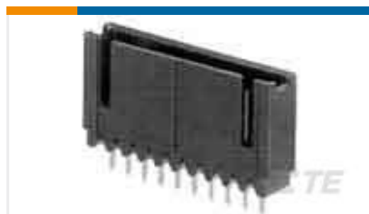
TE 产品编号5-102202-5 08 MODII HDR SRST SHRD LF