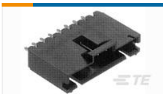
TE 产品编号5-103735-4 05 MTE HDR SRST LATCH .100CL