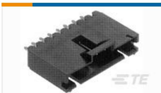
TE 产品编号5-103735-1 02 MTE HDR SRST LATCH .100CL