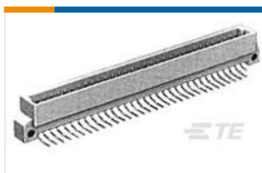
TE 产品编号536052-5 064 EURO TYPE B PIN ASSY