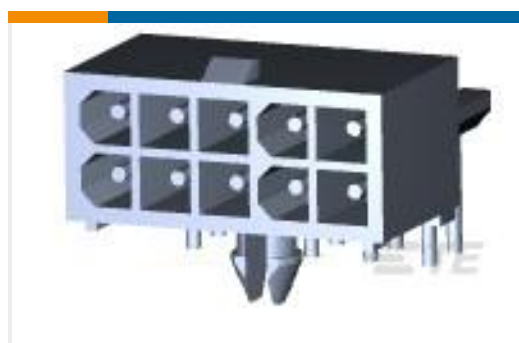
TE 产品编号1-770971-1 10P MINI UMNL R/A HDR ASSY LF