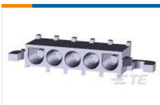
TE 产品编号643232-1 05P UMNL HDR ASSY R/A 94VO