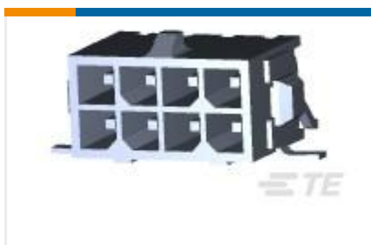
TE 产品编号3-794627-8 08P MICRO MNL ASSY, RA, SMT, L