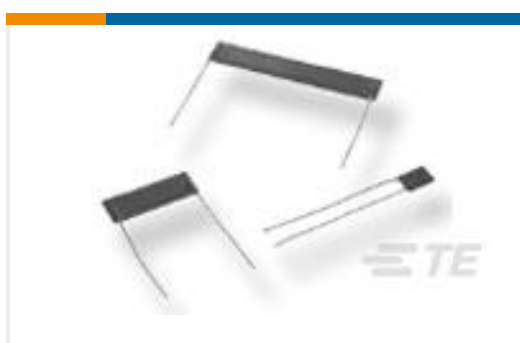
TE 产品编号1625960-9 HBA RE 47M 1% 100PPM