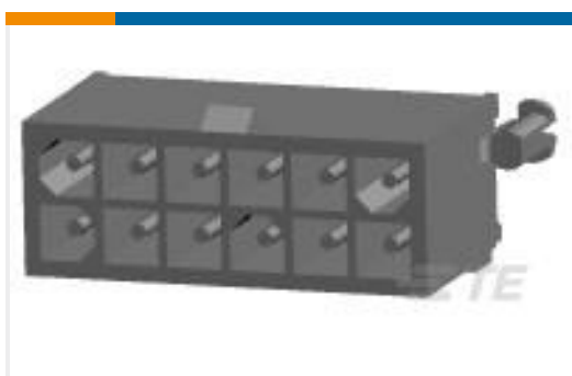
TE 产品编号1-794066-1 12P MINI UMNL HDR W/DH AU LF