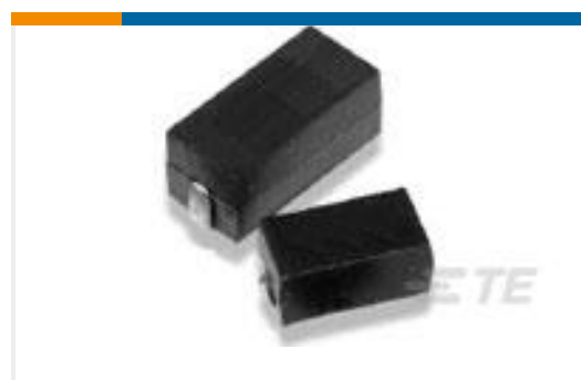
TE 产品编号1-1879022-3 SMF3 1K0 5%