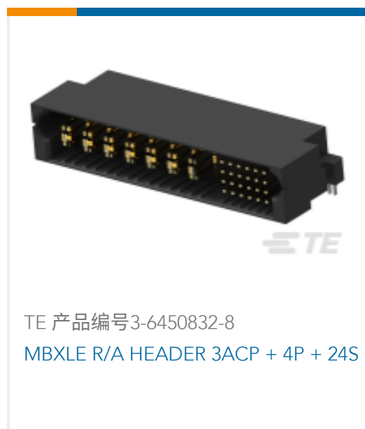
TE 产品编号3-6450832-8 MBXLE R/A HEADER 3ACP + 4P + 24S