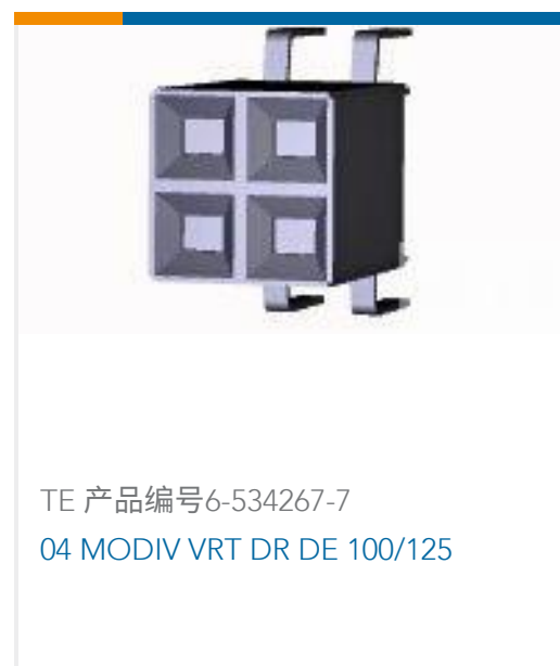
TE 产品编号6-534267-7 04 MODIV VRT DR DE 100/125