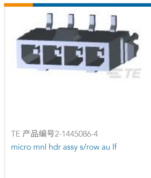
TE 产品编号2-1445086-4 micro mnl hdr Assy s/row au lf