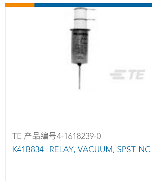
TE 产品编号4-1618239-0 K41B834=RELAY, VACUUM, SPST-NC