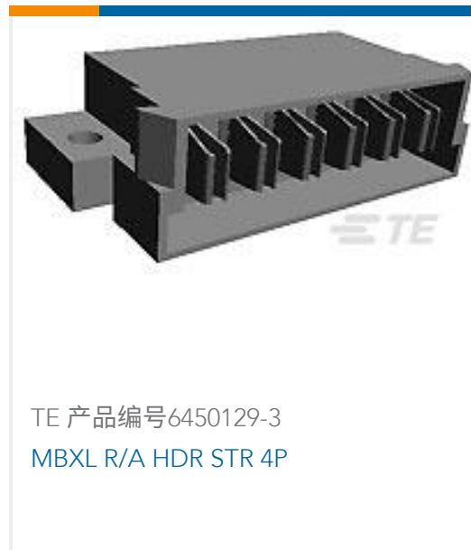
TE 产品编号6450129-3 MBXL R/A HDR STR 4P