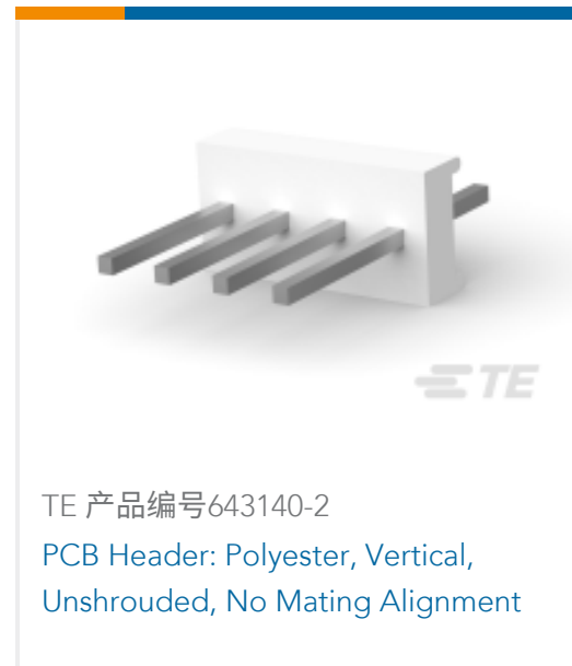
TE 产品编号643140-2 PCB Header: Polyester, Vertical, Unshrouded, No Mating Alignment